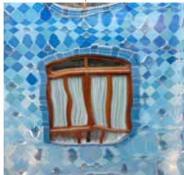
Detalle de la Casa Batlló