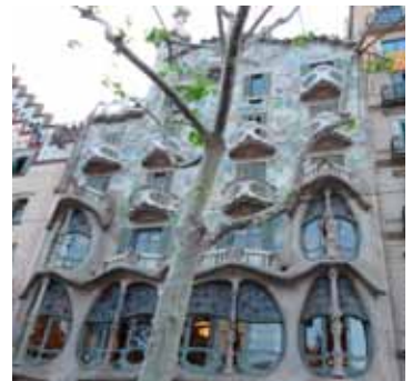
Fachada de la Casa Batlló

Gaudí no es el único modernista que utilizó Barcelona como lienzo. En la ciudad hay más de 2.000 edificios con elementos de esta corriente. Imposible verlos todos. Algunos de los más significativos son: PALAU DE LA MÚSICA , EL HOSPITAL DE SANTA CREU I SANT PAU , LA CASA THOMAS , EL HOTEL ESPANYA (San Pau, 9-11)... Como curiosidad. En el Paseo de Gracia, entre las calles de Aragón