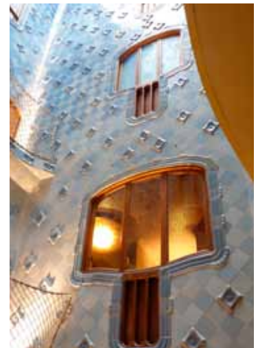
Vista desde el Parque Guell e interior de la Casa Batlló

Sería pretencioso, e imposible, enumerar todos los lugares interesantes de Barcelona. Os hago un resumen de lo que no me perdería - ni harta de cava del Penedés- si visitase 3 o 4 días en la Ciudad Condal. El recorrido empieza descubriendo el modernismo catalán y los principales monumentos de Gaudí, atraviesa - despacio, a pesar del bullicio- las Ramblas, recorre algunos de los