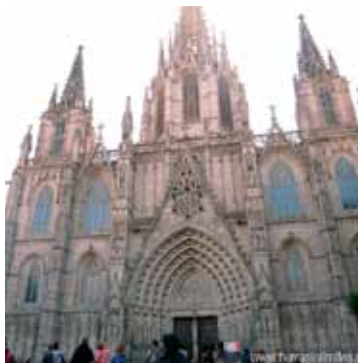
La Catedral y el Barrio Gótico

Centro histórico de Barcelona y uno de los barrios de la Ciutat Vella, en él se sitúan numerosos monumentos: la CATEDRAL GÓTICA DE SANTA