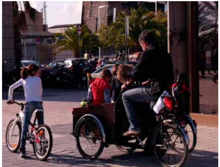
Barcelona es ciudad de bicis

Aunque en Barcelona existe un servicio público de BICIS está más orientado a residentes y es compli-