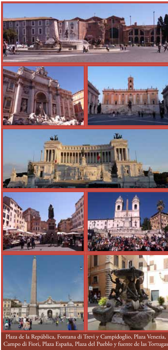
Plaza de la República, Fontana di Trevi y Campidoglio, Plaza Venezia, Campo di Fiori, Plaza España, Plaza del Pueblo y fuente de las Tortugas

Otras plazas famosas: plaza del Campidoglio (el Capitolio), la Rotonda (Panteón), Montecitorio (donde está la Cámara de los Diputados), Piazza Mattei y la fuente de las Tortugas.