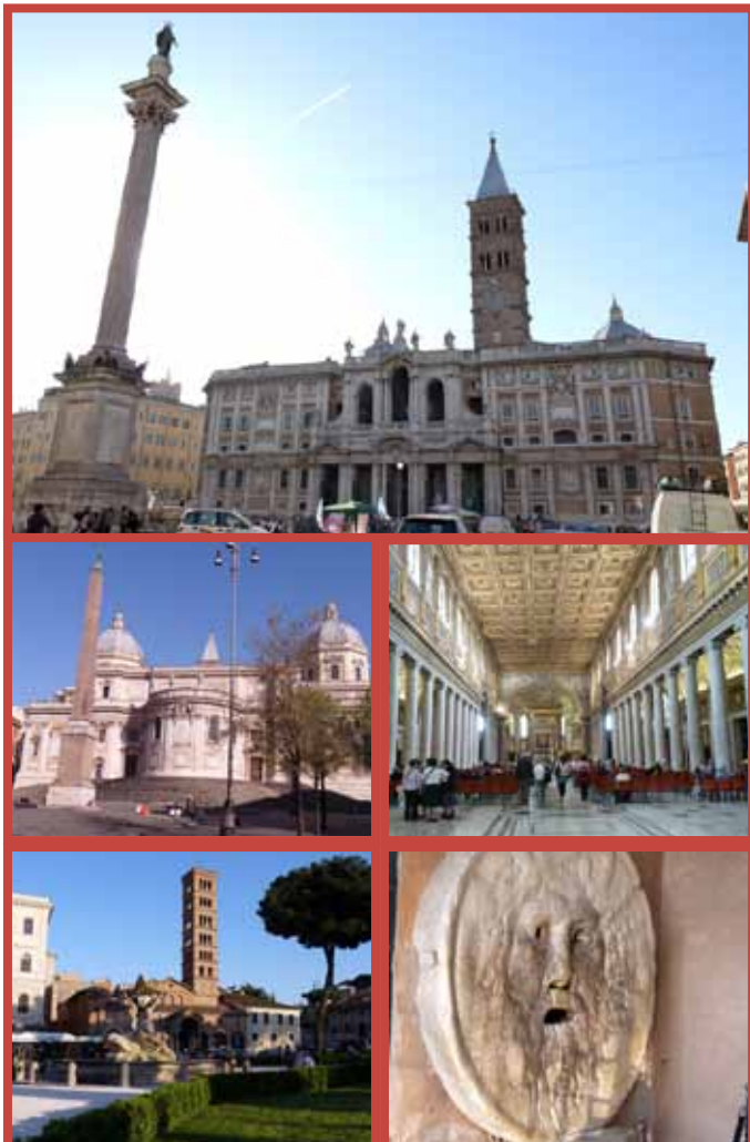
Las tres primeras fotos corresponden a la iglesia Santa María la Mayor, las dos últimas a Santa María in Cosmedin, localizada en una zona monumental y cerca de la Isla Tiberina.

Iglesia de Santa María in Cosmedin. Metro Circo Massimo 800 m. Atrae a los turistas por la Bocca della Verità que se cree que era una antigua tapa de alcantarilla. La leyenda dice que si metes la mano en el hueco de la boca y dices una mentira se cierra sobre ti. Lo más destacado de la iglesia es el coro y el campanario.