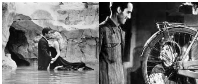
Fotogramas de la “Dolce Vita” y de “El ladrón de bicicletas”, dos clásicos ambientados en Roma.