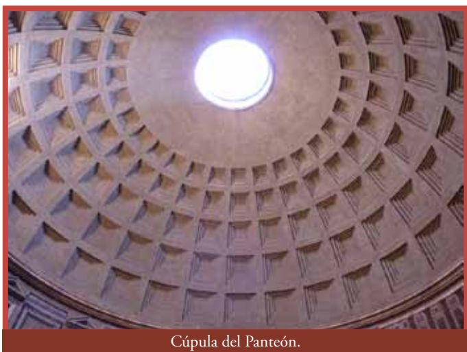
Cúpula del Panteón.

La plaza que hay delante del Panteón siempre está muy animada. En mitad hay una fuente y un obelisco.