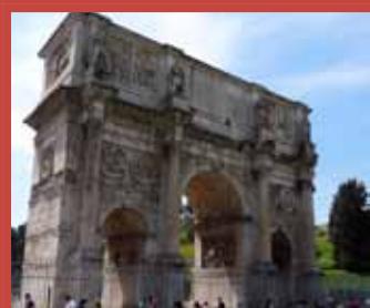
Foro, el Circo Máximo, arco de Constantino