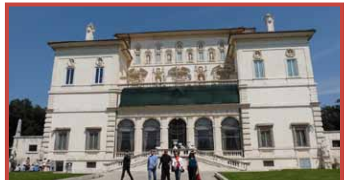
Galería Borghese. Pasead por la Villa Borghese, su parque.