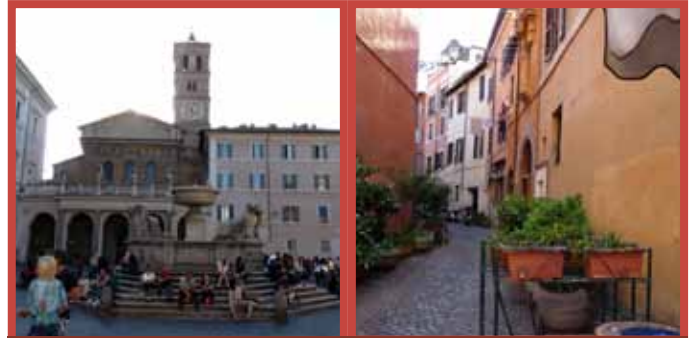
Piazza del Trastevere, Santa María del Trastevere, en la misma plaza, y callejuela de este barrio

TRASTEVERE. Es un barrio más animado de Roma y está situado en la orilla oeste del Tíber. Ideal para acercarse a cenar y tomar una copilla y de paso ver la plaza Santa María del Trastevere, la Basílica con el mismo nombre, un par de puertas de la muralla Aureliana, algunos palacios (San Calisto), la iglesia donde se cuenta que fue crucificado San Pedro (San Pietro In Montorio). Además este "rioni" conserva el típico pavimento romano "sampietrini".