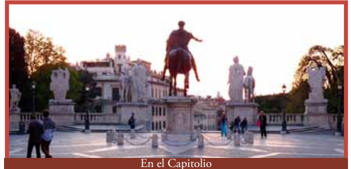
En el Capitolio

El Capitolio se encuentra en una de las siete colinas de Roma, la plaza fue proyectada por Miguel Ángel y en ella encontramos dos palacios similares que albergan los museos (en su interior hay obras como la loba capitolina) y el edificio del Ayuntamiento donde se firmaron los tratados de la CEE y la CEEA.