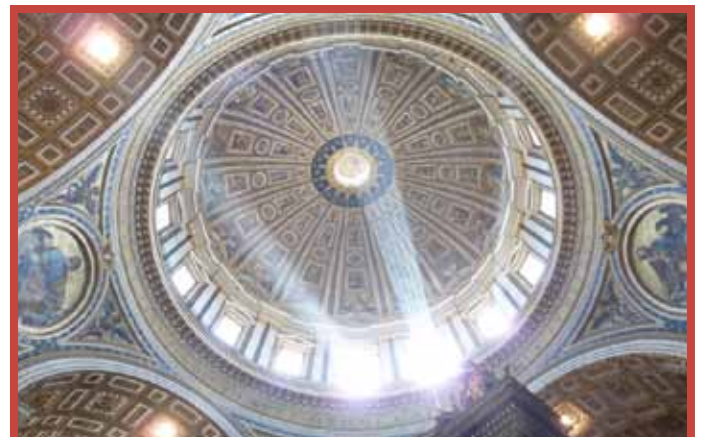
Cúpula de Miguel Ángel, en la Basílica de San Pedro