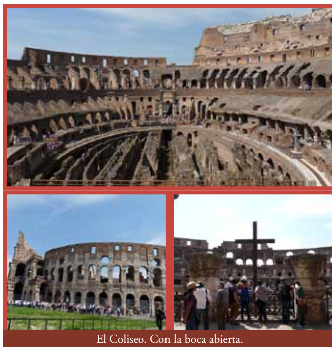
El Coliseo. Con la boca abierta.

Cuando estás en la fila, algunos guías privados ofrecen sus servicios. Son más caros que las visitas guiadas que ofrecen dentro.