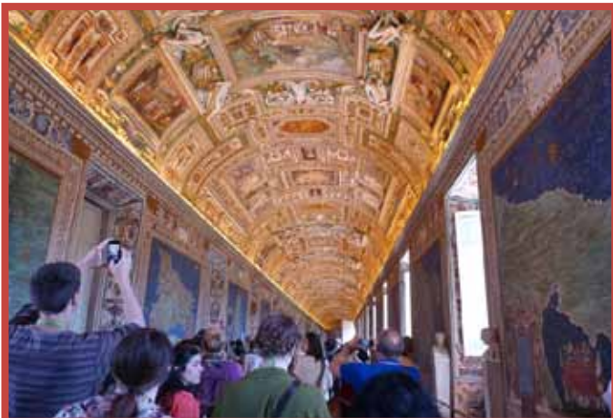
La galería de los mapas alberga 40 mapas de zonas italianas. Al lado de cada uno de ellos se desarrollan escenas de santos ocurridas en ese lugar.

La cúpula. Lo más característico de este imponente edificio es su cúpula. Fue proyectada por Miguel Ángel y alcanza los 132 metros de altura y 42,5 metros de diámetro. Si tenemos tiempo, ganas y una buena condición física podemos subir por 5 o 7€ (andando o en ascensor). Desde lo alto, las vistas del Vaticano son impresionantes, pero suele haber bastante cola.