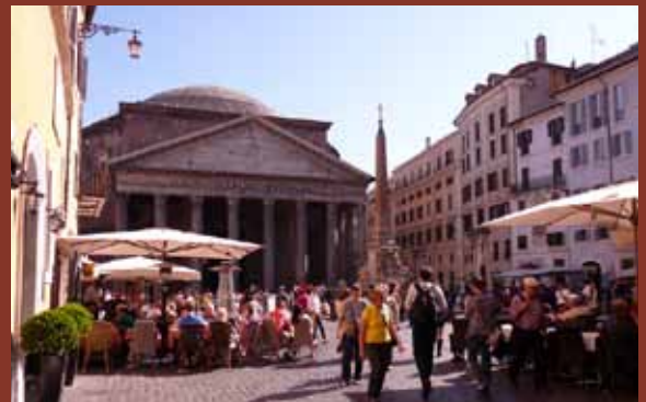
El Coliseo. La Basílica de San Pedro. El Foro. Piazza Navona. Capitolio. El Panteón.