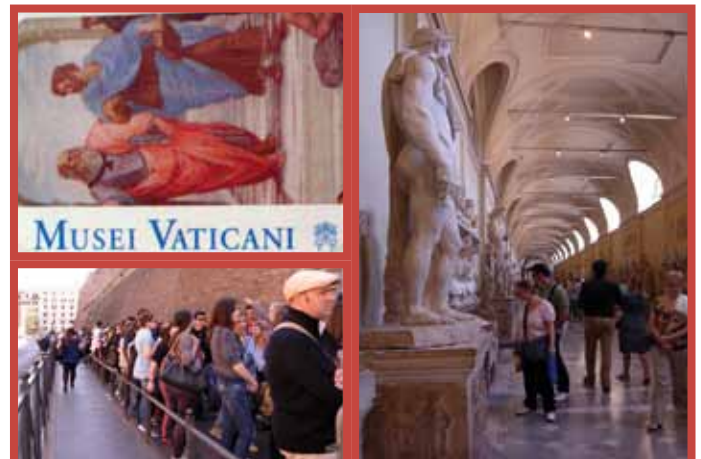
Entrada a los Museos Vaticanos, la cola que hacer para entrar y una de las galerías.

Las basílicas patriarcales ubicadas extramuros también son propiedad de la Santa Sede: San Pablo Extramuros, San Juan de Beltrán y Santa María la Mayor.