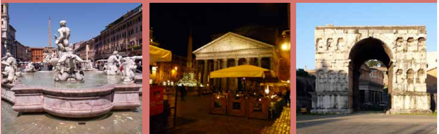
PIAZZA NAVONA. Roma está llena de plazas con fuentes, edificios únicos y mucha vida. EL PANTEÓN POR LA NOCHE. Un templo romano que hoy es iglesia. Una recomendación: pasear por la noche y acercarnos a sus monumentos · ARCO DE JANO. Un arco cuádruple que se encuentra cerca de Santa María in Cosmedin. Se cree que se levantó para delimitar el foro Boario.

A Roma la llaman la ciudad eterna y los tópicos siempre tienen algo de verdad. A orillas del Tíber, Roma ha visto pasar la historia y ha permitido que esta deje huella por sus calles. Visitarla equivale a viajar en el tiempo. Podemos embelesarnos con la belleza de su arquitectura, con la grandiosidad de sus construcciones y con los detalles de las obras de arte de sus museos. Nos encontraremos metidos de lleno en una ciudad repleta de vida (y caos), pero con reductos para escaparnos de tanto jaleo. Toda ella es un museo en constante movimiento. A veces, tendremos la sensación de estar inmersos en un escenario, en el escenario de alguna de las películas rodadas en sus calles, porque Roma es, también, una ciudad de cine.