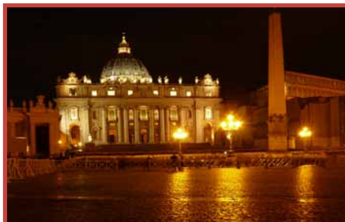
Plaza y Basílica de San Pedro en el Vaticano

METRO: CIPRO - MUSEI VATICANI // OTTAVIANO.