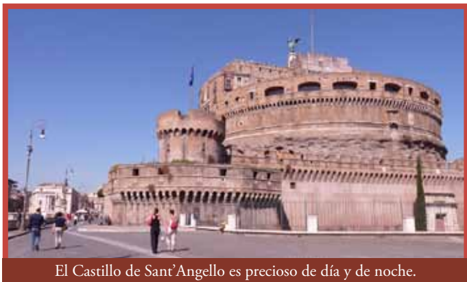
El Castillo de Sant'Angelo es precioso de día y de noche.

Ya fuera de la frontera del Vaticano podemos ver este castillo de gran importancia para la Iglesia. Se encuentra conectado por un pasadizo subterráneo (Passetto) con el Vaticano desde el siglo XII y se accede a él desde Roma por el puente de Sant'Angelo y desde el Vaticano por la Avenida Via de la Conciliación. Fue construido en la época romana para albergar las cenizas de Adriano, posteriormente sus usos y apariencias han ido cambiando. Se conoce con el nombre actual desde el s.VI cuando, en mitad de una epidemia de peste, el papa Gregorio I vio al arcángel San Miguel. Su estatua corona el castillo. Hoy en día el edificio es sede de un museo.