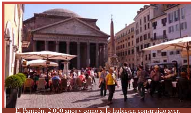
El Panteón. 2.000 años y como si lo hubiesen construido ayer.